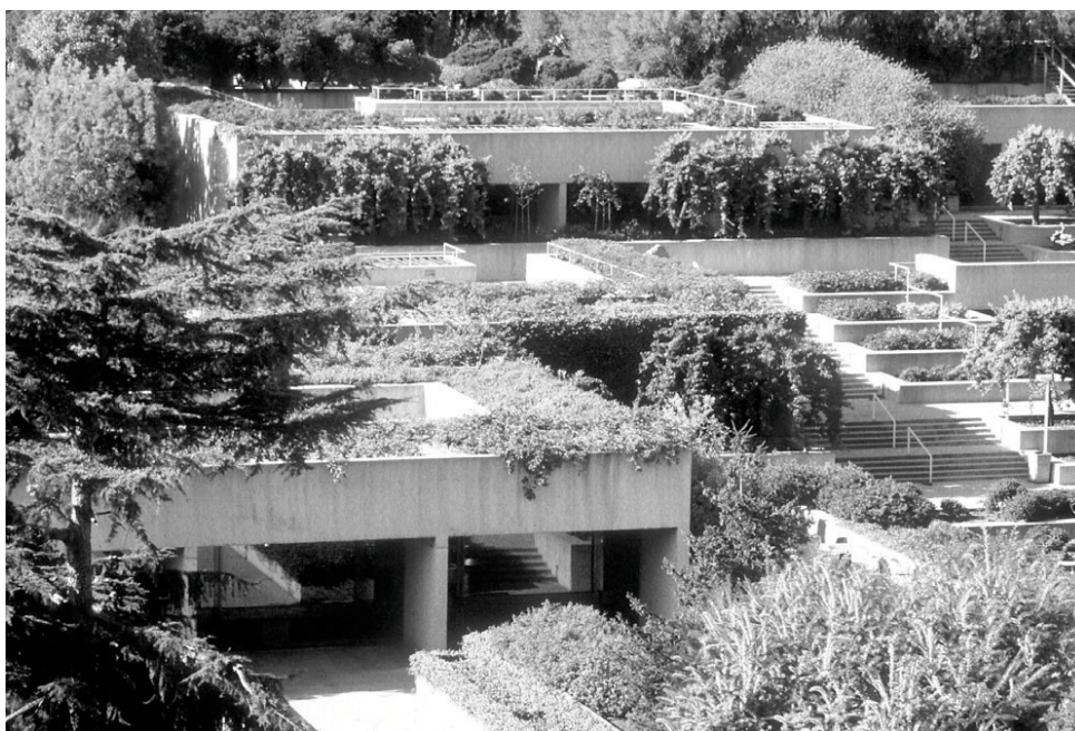
Figura 6 - Detalle de la vegetación sobre las terrazas del OMCA.

Su objetivo era conseguir un efecto ‘descuidado’, de crecimiento natural de las plantas. Una especie de invasión del mundo vegetal sobre la arquitectura mediante el uso extensivo de especies que cubren el suelo, trepan por las paredes y cuelgan de las pérgolas.