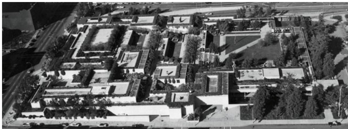
Figura 8 - Vista general del Museo de Oakland, California.

En conclusión, el gran mérito de este museo es la utilización de mecanismos tradicionales (un edificio introvertido, muros de hormigón, vegetación...) para conseguir una perfecta integración entre la arquitectura, el arte y la naturaleza. Una propuesta de nuevo entorno para los objetos artísticos que no es tanto un edificio sino una gran plaza pública, una serie de pasos y caminos que sirven de guía a través de un ingenioso laberinto de experiencias visuales.