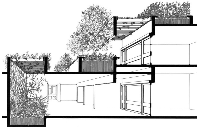
Figura 7 - Sección – detalle de la conexión entre las terrazas y las galerías.

Estos umbrales se cualifican espacialmente de diferentes maneras. En ocasiones se plantan arbustos en el suelo, pero en otros casos se deja caer la vegetación entre los travesaños de las pérgolas que, a su vez, propician un cambiante juego de luces y sombras. También se usan para marcar un cambio de altura entre dentro y fuera o, sencillamente, aparecen desnudos como grandes oquedades dentro de este objeto escultórico que es el Museo de Oakland.