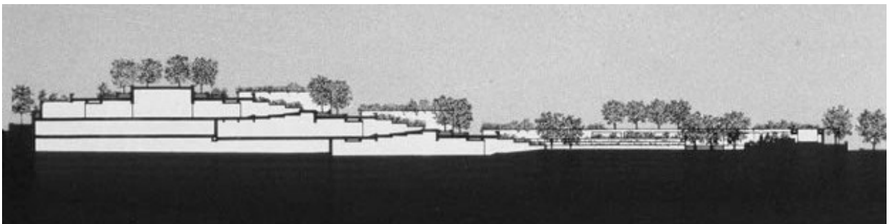
Figura 5 - Sección longitudinal del Museo de Oakland

“La función es un camino directo hacia la forma. El simbolismo, la idea y la continuidad con el entorno son también consideraciones vitales en arquitectura y la forma también es la expresión de estos conceptos ya que amplifican nuestro entendimiento de la función. Además de cómo actúan las cosas, la forma es también lo que implican. Las formas existentes presuponen cómo usamos los edificios, y las formas potenciales son visiones de cómo deberíamos usarlos 9 . “