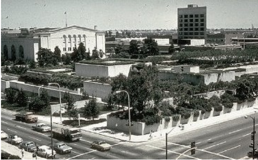
Figura 04 - Vista aérea del OMCA en la que se aprecian los elementos principales del edificio: una vegetación exuberante y planos horizontales de hormigón formando un juego volumétrico que desdibuja la fachada tradicional y favorece su entendimiento como un 'no-edificio'.

Otro recurso que contribuye a la sutil presencia física del edificio es la horizontalidad. Roche y Dinkeloo recurrieron a los planos horizontales para enfatizar la continuidad con el entorno, acompañar a la topografía mediante el descenso de estas superficies apaisadas y además, favorecer la fluidez del movimiento. Se materializaba así el concepto de elemento continuo con posibilidad de extenderse hasta el infinito que, además, reforzaba la condición de continuidad espacial con la que KRJDA pretendían dotar al museo moderno.