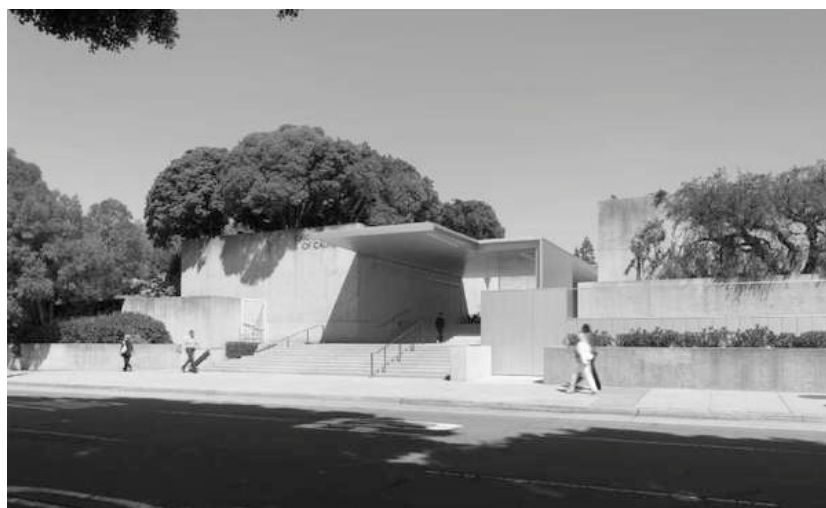
Figura 3 - Vista parcial del alzado principal.

embargo, ofrece un juego de volúmenes a distintas alturas colmados de vegetación que dibujan un límite totalmente alejado de cualquier sensación de barrera infranqueable. Al contrario, construye un discreto juego de volúmenes con muretes de hormigón que permiten su utilización como asientos a los viandantes.